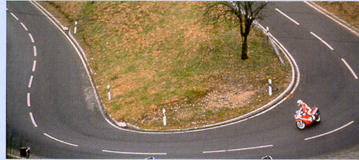
Abbildung 33: Dieser Fahrer bleibt betont lange außen.