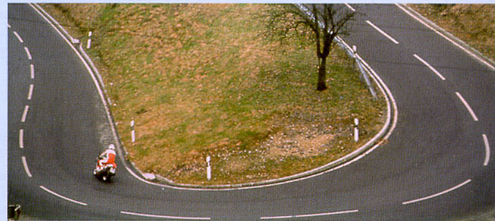
Abbildung 35: Im Kurvenausgang hat er große Sicherheitsreserven.