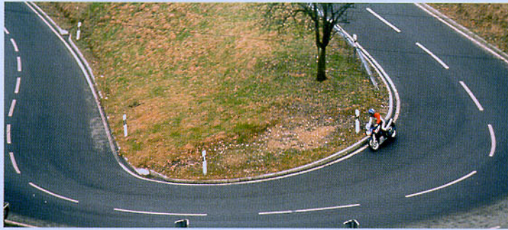
Abbildung 30: Der Fahrer befindet sich schon früh ganz innen, auf den ersten Blick sieht alles ganz unbedenklich aus.

Hat man sich in die schematischen Kurvendarstellungen vertieft, kann man aus der vielgestaltigen Wirklichkeit, die nie die modellhafte Eindeutigkeit einer Schemazeichnung haben kann, viel mehr herauslesen: