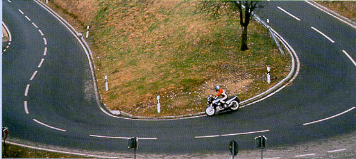
Abbildung 31: Auch hier ist noch nichts Auffälliges zu bemerken.