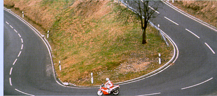
Abbildung 34: Er ist noch immer nicht ganz innen, seinen Scheitelpunkt hat er fast an das Kurvenende verschoben.