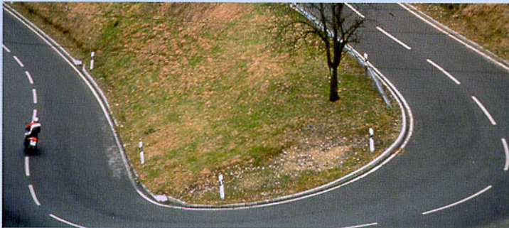
Abbildung 32: Im Kurvenausgang aber kann es bei Gegenverkehr gefährlich eng werden.