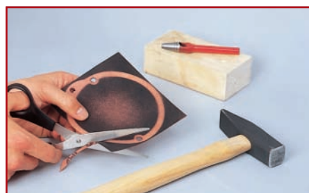
4. Dichtung sauber mit einer Schere ausschneiden

4. Die Dichtung nun sauber mit einer Schere ausschneiden. Haben Sie aus Versehen die Dichtung an einer falschen Stelle