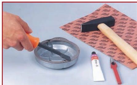
1. Dichtungsreste rückstandslos entfernen