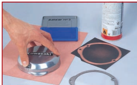
2. Mit Stempelkissen oder Farbspray einen Abdruck erzeugen