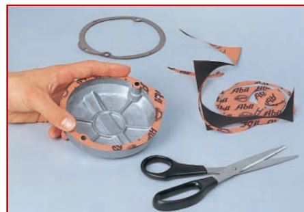
5. Passgenauigkeit und Anzahl der Löcher prüfen

5. Zum Schluss wird noch einmal die Passgenauigkeit und die Anzahl der Löcher überprüft. Vorsicht im Umgang mit Dichtmasse. Wenn entschieden wurde, welche Dichtmasseart zu benutzen ist, tragen Sie die Dichtmasse nur dünn auf. Zuviel aufgetragene Dichtmasse kann großen Schaden nach sich ziehen: Beim Festziehen des Deckels quillt überschüssige Dichtmasse nicht nur nach außen, sondern auch ins Motorinnere und gelangt dann in den Ölkreislauf. Kleine Ölbohrungen werden unter Umständen verschlossen, ein Motorschaden kann die Folge sein.