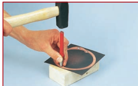
3. Löcher ein wenig größer als Schrauben-Ø ausstanzen

Lassen Sie sich nicht Ihre Sonntagsausfahrt oder den Urlaub verderben, wenn es nur an einer kleinen Papierdichtung hapert. Ihr Vertragshändler kann aus Platzgründen nicht immer alle Dichtungen vorrätig haben. Glücklicherweise lassen sich viele Dichtungen einfach und gut selbst herstellen (außer z.B. die Zylinderkopfdichtung) und das nicht nur in Notsituationen.